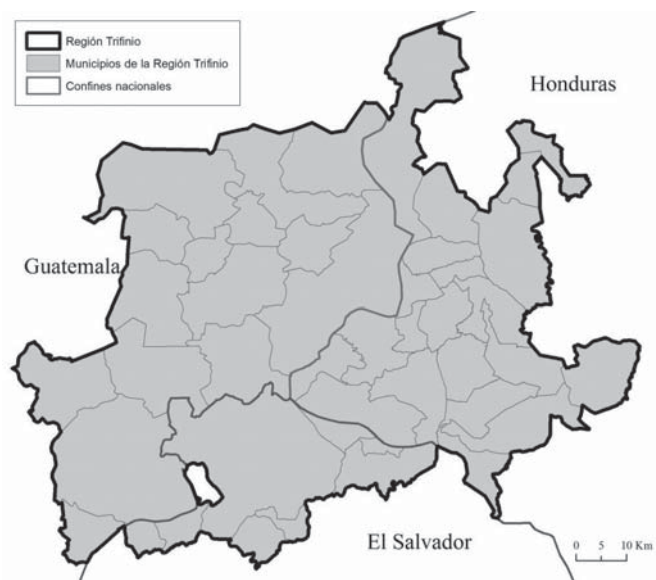
Figura N° 1 Los municipios de la región Trifinio

de cooperación transfronteriza y gobernanza local. Sin embargo, estas características no son suficientes para establecer un proceso de integración transfronteriza. Para tal fin, es necesario que exista la voluntad política –tanto a nivel local como a nivel de los Estados involucrados–, necesaria para avanzar con un proyecto de cooperación.