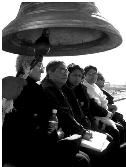
« Justicia para nuestras hijas »

El Estado mexicano alegó en el caso que la Corte no tenía competencia para investigar violaciones a la Convención Belém do Pará y sostuvo que los hechos de desapariciones y homicidios de mujeres en Ciudad Juárez no eran hechos de violencia contra las mujeres, sino violaciones a derechos humanos sólo relacionadas con las garantías judiciales para sus familiares. Estas resistencias permitieron a la Corte desarrollar elementos que clarifican el concepto de violencia contra las mujeres así como las obligaciones de debida diligencia para prevenir, investigar y sancionar dicha violencia.