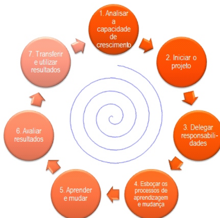
Figura 3 – Os sete passos do Método “Aprender a Crescer”

Ao longo do processo de aplicação, as empresas participam em reuniões de intercâmbio de experiências e melhores práticas aplicadas, constituindo uma forma de aprendizagem interorganizacional.