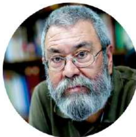
CÁNDIDO MÉNDEZ RODRÍGUEZ

Exsecretaria de Estado de Empleo del Ministerio de Trabajo e Inmigración de España, Gobierno de España