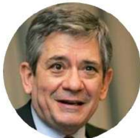
ENRIQUE BARÓN CRESPO

Expresidente de la República de Costa Rica y Premio Nobel de la Paz