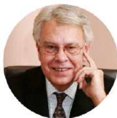
FELIPE GONZÁLEZ Expresidente del Gobierno de España

EL RETO DE TRABAJAR JUNTOS ANTE EL NUEVO ORDEN (O DESORDEN) INTERNACIONAL