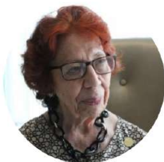
CARMEN MORENO TOSCANO Subsecretaria de Relaciones Exteriores de México

EL MARCO DE LAS RELACIONES UE-ALC EN EL ACTUAL CONTEXTO GLOBAL: INSTITUCIONES, INSTRUMENTOS Y MECANISMOS PARA LA COOPERACIÓN