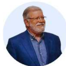
JUAN CARLOS RODRÍGUEZ Miembro de la Academia Europea e Iberoamericana de Yuste