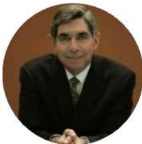
ÓSCAR ARIAS SÁNCHEZ

EL MARCO DE LAS RELACIONES UE-ALC EN EL ACTUAL CONTEXTO GLOBAL: INSTITUCIONES, INSTRUMENTOS Y MECANISMOS PARA LA COOPERACIÓN