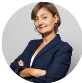
MARÍA LUZ RODRÍGUEZ FERNÁNDEZ

Exsecretaria de Estado de Empleo del Ministerio de Trabajo e Inmigración de España, Gobierno de España