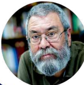
CÁNDIDO MÉNDEZ RODRÍGUEZ

Juez de la Corte Iberoamericana de DDHH, de la que ha sido presidente y expresidente de la Corte Constitucional Colombiana Perspectiva desde los DDHH