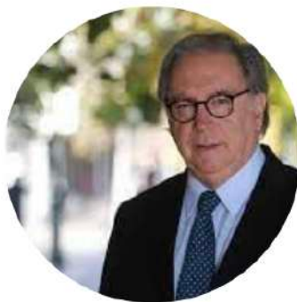
JUAN GABRIEL VALDÉS Excanciller de Chile

¿QUÉ FUTURO PARA LAS RELACIONES UNIÓN EUROPEA-AMÉRICA LATINA Y EL CARIBE?