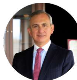
HERNANDO PARRA NIETO Rector de la Universidad Externado de Colombia