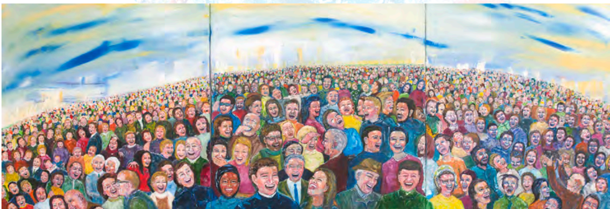
Cuando la utopía alcanzó a la realidad – Óleo sobre lienzo – Tríptico cada uno 100x100 cm