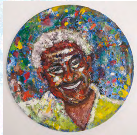
Música de la Risa 3 – Óleo sobre lienzo – 40 cm Ø