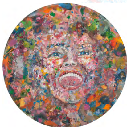
Música de la Risa 6 – Óleo sobre lienzo – 40 cm Ø